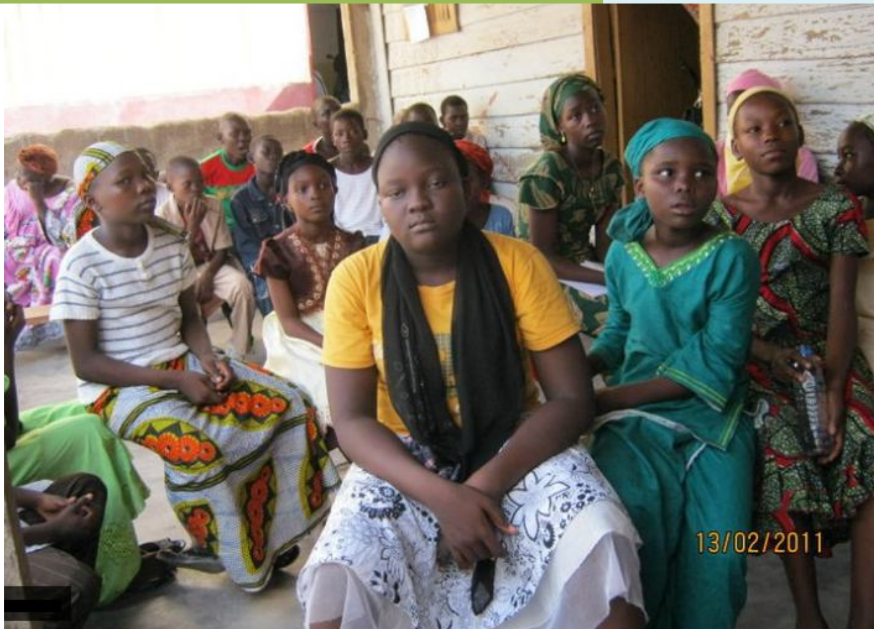
Les élèves de la classe III dans la Paroisse de Bonaloka

« Il est lamentable aujourd'hui de constater que l'Ecole du Dimanche qui est la base et le pilier du devenir de l'Eglise soit ainsi négligée. Aucune considération digne ne lui est encore accordée... »